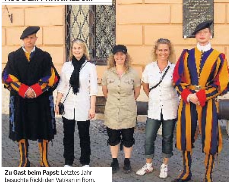
Zu Gast beim Papst: Letztes Jahr besuchte Rickli den Vatikan in Rom.