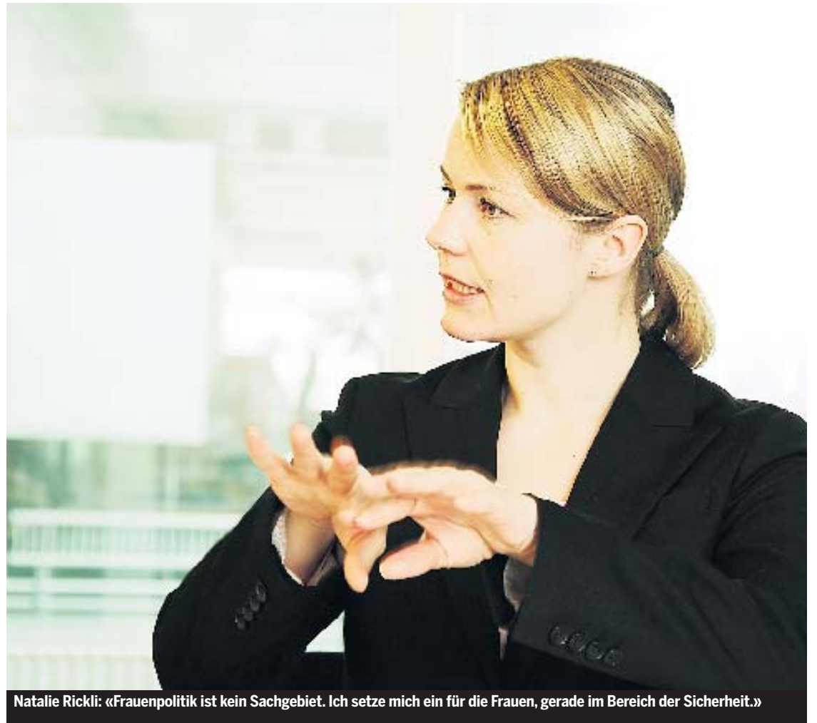
Natalie Rickli: «Frauenpolitik ist kein Sachgebiet. Ich setze mich ein für die Frauen, gerade im Bereich der Sicherheit.»

Keineswegs. Ein paar wollen sich jetzt einbürgern lassen und der SVP beitreten. Vor den Nationalratswahlen haben sie ein Plakat mit meinem Bild auf der