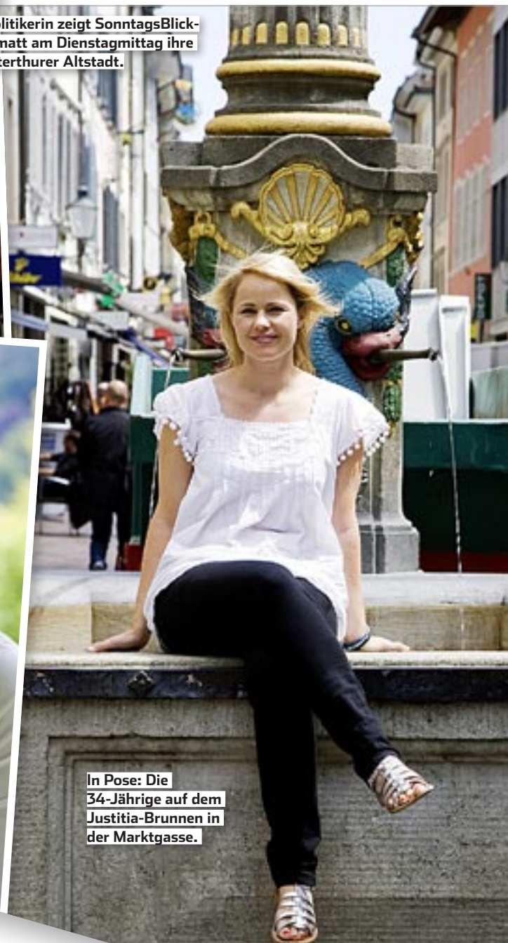
In Pose: Die 34-Jährige auf dem Justitia-Brunnen in der Marktgasse.