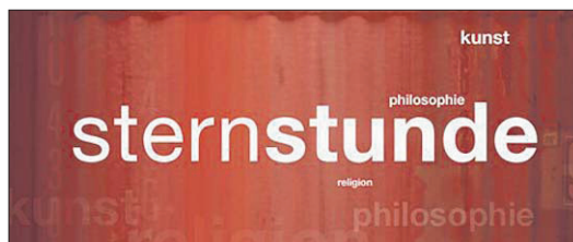
Eine Sternstunde für die linke Schweizer Medienlandschaft.